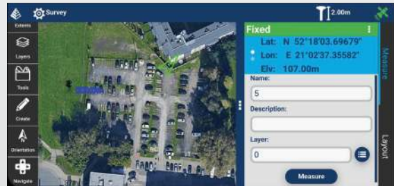
Maak gebruik van 'live' achtergrondkaarten.