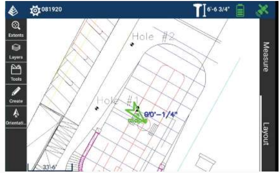
Direct importeren van tekeningen in DXF/DWG formaat.

Carlson Software werd opgericht in 1983 en is gespecialiseerd in CAD-ontwerpsoftware, veldboeksoftware, lasermetingen en machine besturingsproducten voor weg- en waterbouw, de Geo-info en GIS toepassingssector en over de hele wereld. Carlson is er trots op om gebruikers een volledige product-range aan te kunnen bieden, vanaf de ontwerpfase tot de realisatie in het terrein. Eén leverancier voor de complete projectcyclus!