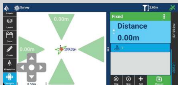
Gebruikersvriendelijke aanwijzingen voor pecies uitzetwerk.