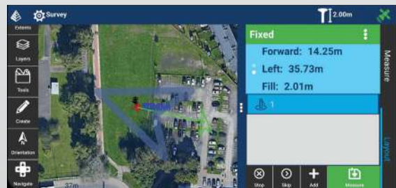
Eenvoudige navigatie naar punten, lijnen en vlakken.